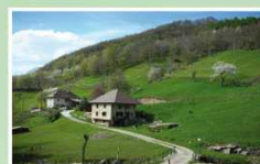
Les Chênes : vue et lavoir