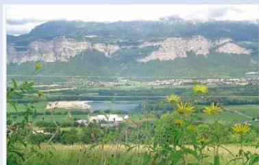
Vue sur la vallée du chemin des Eymins

En 1661, André de Monteynard, Seigneur de La Pierre, du Champ et du Châtelard, s'est adressé au notaire Mécou pour qu'il établisse un état des lieux du château du Châtelard dont il est le propriétaire. Deux experts (un charpentier et un maçon) préciseront les travaux à effectuer. Avant la Révolution, cette place forte disparaîtra pour ne laisser qu'une tour.