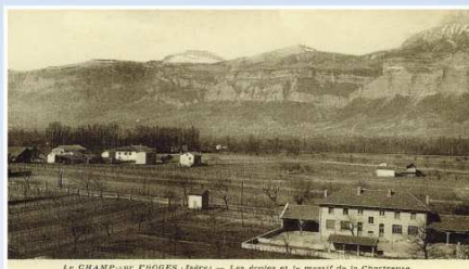
Carte postale 1936 - Vue aérienne de l'école