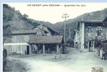
Lavoir dans les années 1940