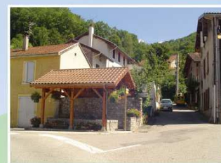
Lavoir rénové en 2003