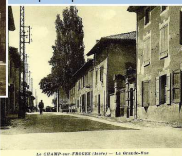
Le CHAMP-sur-FROGES (Isère) — La Grand-Rue

Au Bas-Champ et au Bas-Frogès - Rue principale.